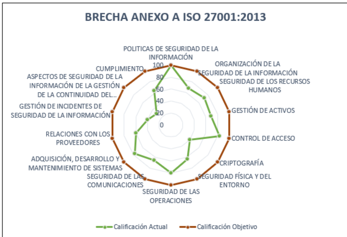
Figura2. Brecha existente

La siguiente imagen muestra la brecha existente frente al Modelo de Seguridad y Privacidad de la Información – MSPI: